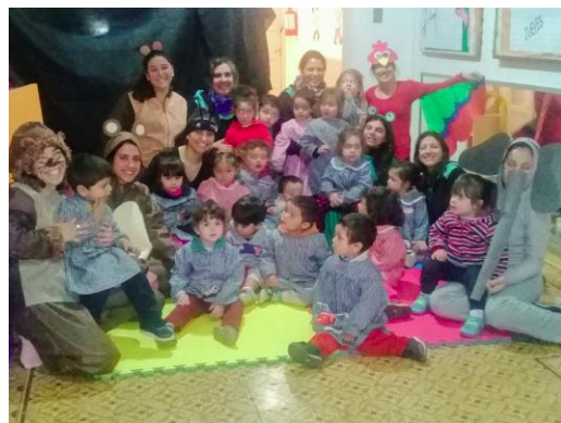
(Florida, Uruguay. 2017). Bebeteca móvil CAIF Prado Español 2017. (Florida, Uruguay. 2018). Bebeteca móvil CAIF Las Palomitas, Florida 2018.

Los estudiantes realizan evaluaciones grupales de sus procesos, dos veces al año (a la mitad del proceso y hacia el final) cada equipo comunica sus experiencias a otros compañeros que se encuentran realizando sus trayectorias en diferentes turnos o días.